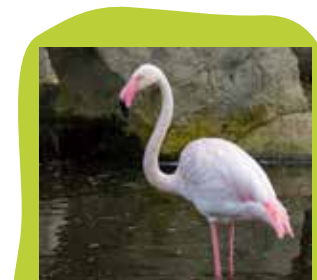
Grote Flamingo Europa, Afrika en Azië