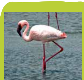
Kleine flamingo Tanzania

In het wild leven er zes verschillende flamingosoorten. Waar de Cubaanse flamingo felroze is, heeft de grote flamingo juist een wit verenkleed.