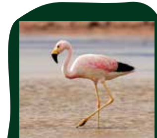
Andes Flamingo Andesgebergte