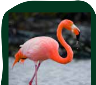
Cubaanse flamingo Caribisch gebied